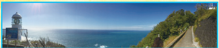
▲室戸岬 (津波到達想定時間3分) (金子真弓会員)