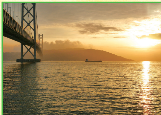
▲明石海峡大橋と夕日（高橋晃司会員）