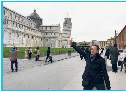
▲ピサの斜塔 (今井健雄会員)