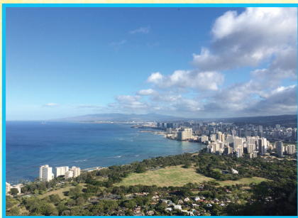
▲ダイヤモンドヘッドから望む ワイキキビーチ