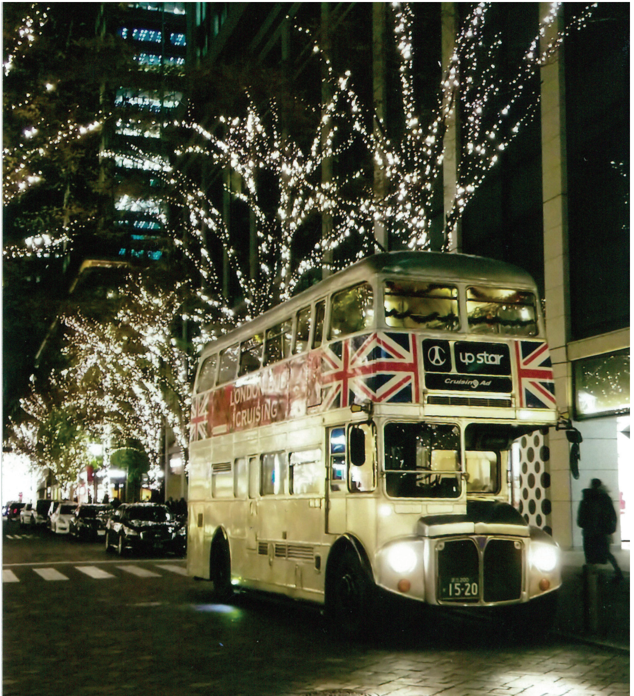
【100号記念フォトコンテスト グランプリ 風景部門】 師走の夜(丸の内にて) (長畑裕史 会員)

発行所 近畿税理士会西支部 〒550-0021 大阪市西区川口2-7-6 公益社団法人 西納税協会内 発行人 山本 仁昭 編集人 茂見 寛二