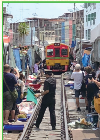
▲市場を走る列車（鈴木一弘会員）