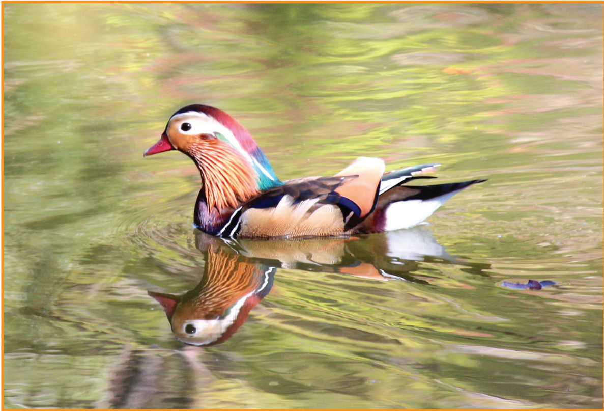
▲オシドリの遊泳（坂口宗春 会員）