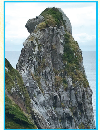
▲吉岐 猿岩 (茂見寛二会員)