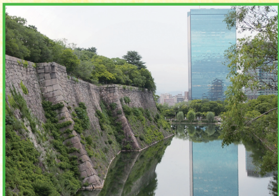
▲大阪城（小林幸一会員）