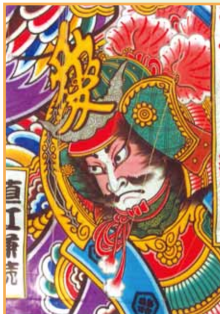
新潟空港 (臼井 治会員)