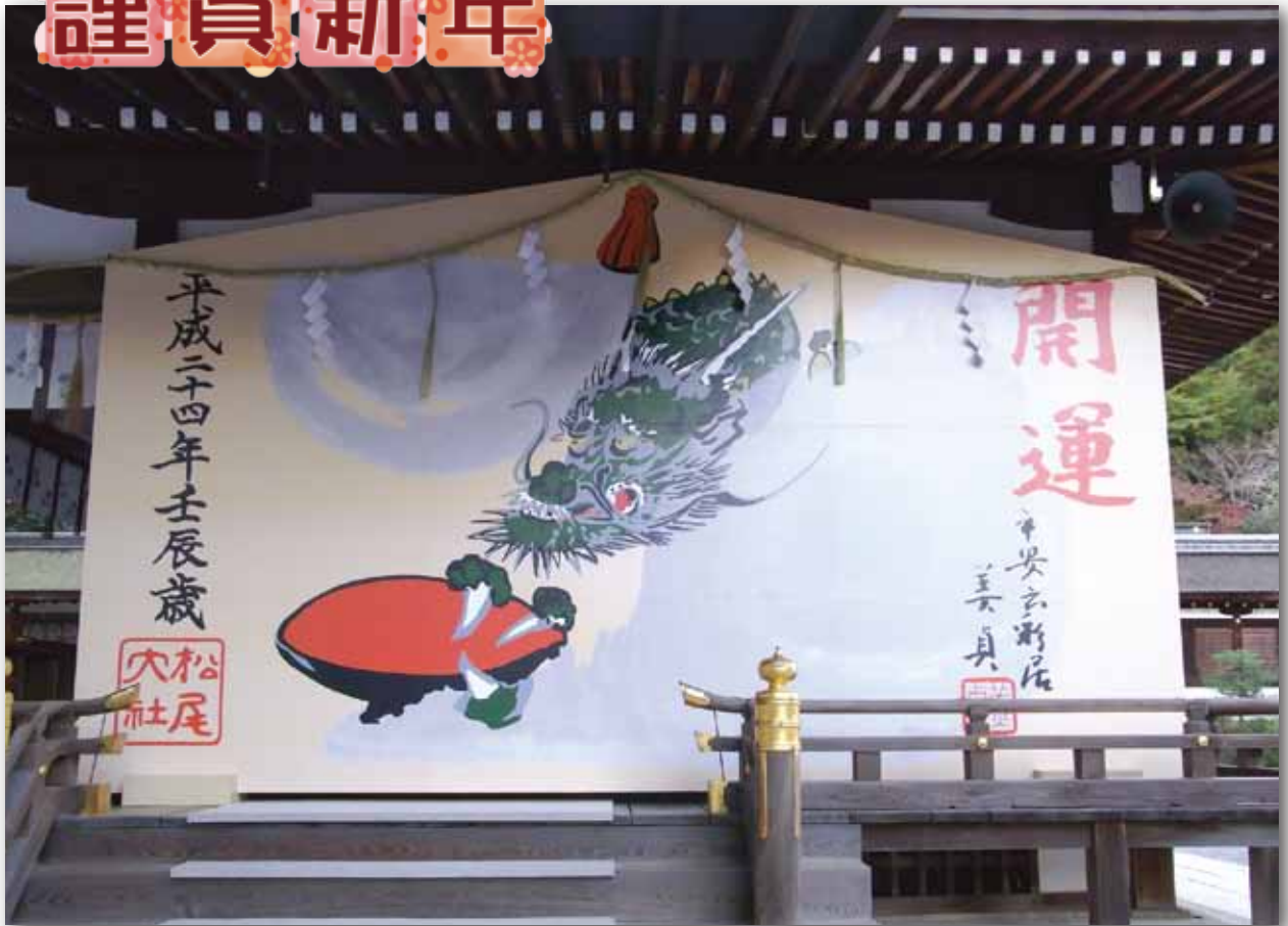
京都松尾大社 (杉本 祐一会員)