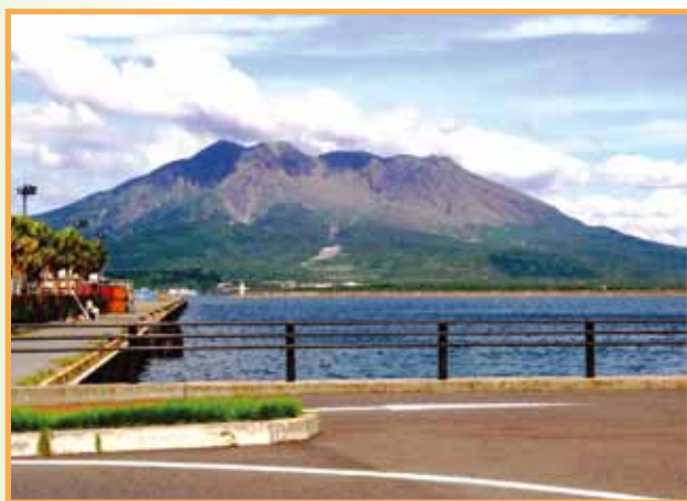
鹿児島 桜島