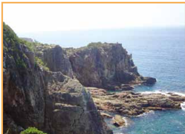
和歌山 白浜 (加治佐 敦智会員)