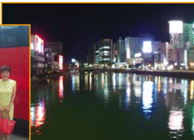
▲支部旅行・中洲 (村尾 一機会員)