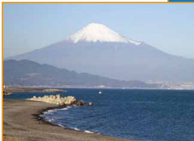
▲富士山 (津國 孝二会員)