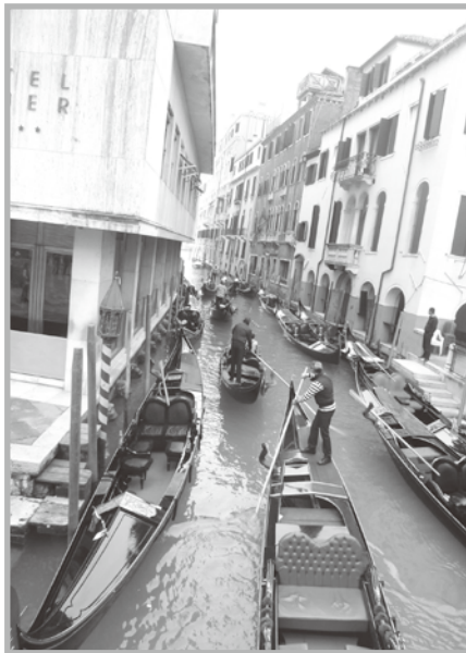
ベネツィア (津國 孝二会員)