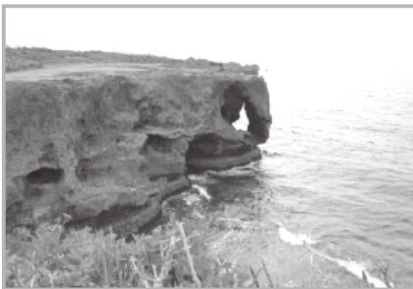
沖縄(万座毛) (尾本 美恵子会員)