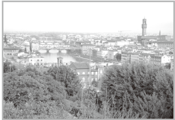
フィレンツェ (津國 孝二会員)