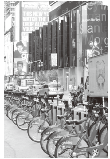
2013年6月から開始されたNYバイクシェアの風景 (自転車共有プログラム) ニューヨークにて

れた私は、年が明け、個人の確定申告から3月決算までの繁忙期が終わり、仕事が一段落すると、心身ともにリフレッシュするため海外を旅したくなる。さあ、今年はどこへ旅しに行こうか。