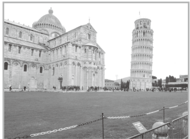
ピサの斜塔