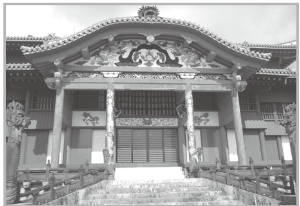
首里城 (尾本 美恵子会員)