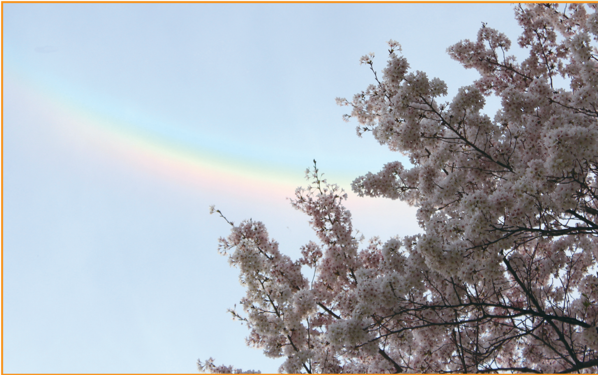
▲虹とさくら (坂口宗春 会員)