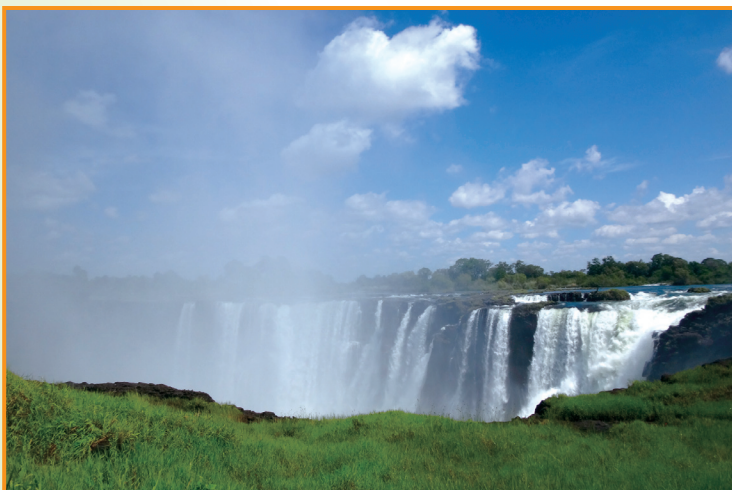
◀ジンバブエから見た水煙をあげる ビクトリア・フォール