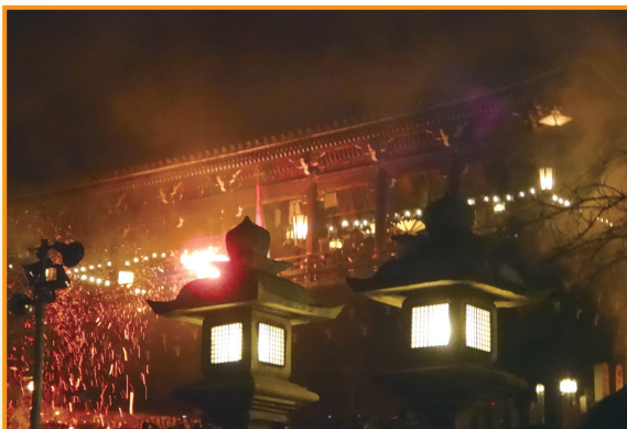
▲奈良東大寺二月堂お水取り (吉栖照美 会員)