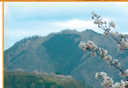
▲立雲峡より竹田城跡を望む (尾本美恵子 会員)