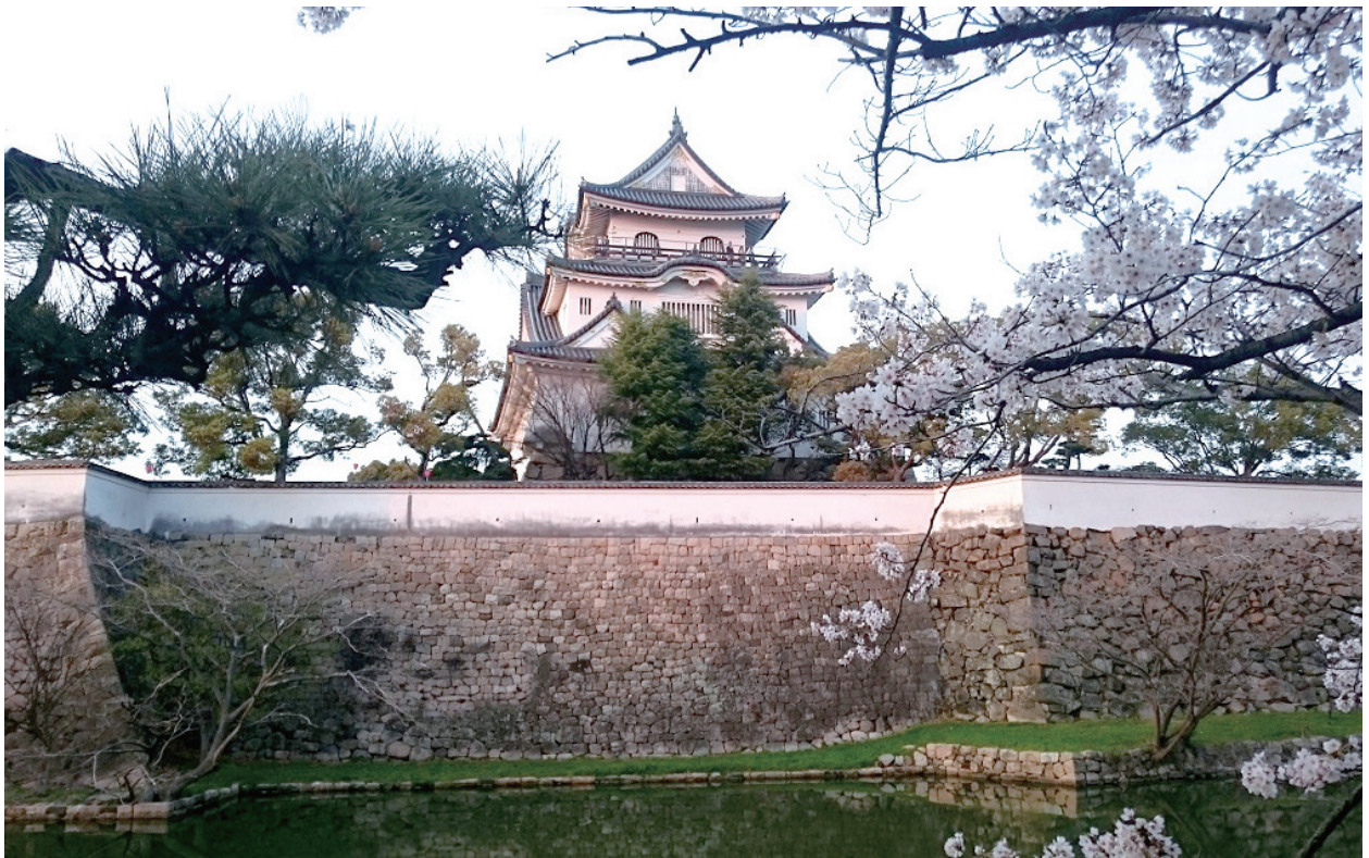
岸和田城と桜 (河井俊幸 会員)

発行所 近畿税理士会西支部 〒550-0021 大阪市西区川口2-7-6 公益社団法人 西納税協会内 発行人 山本 仁昭 編集人 新井 和彦