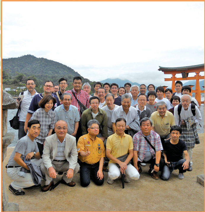
▲ 支部旅行 安芸の宮島