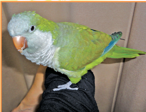
▲ オキナインコの「よもみ」ちゃん 体長30cm、体重80g (島田啓一 会員)