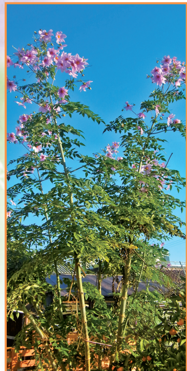
▲ 巨大な「皇帝ダリアの花」に 驚き (尾本美恵子 会員)