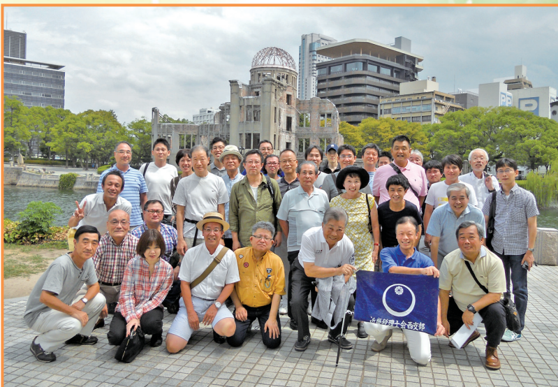
▲ 支部旅行 広島平和記念公園