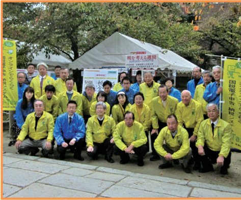
▲ 西区民まつり(税を考える週間行事)