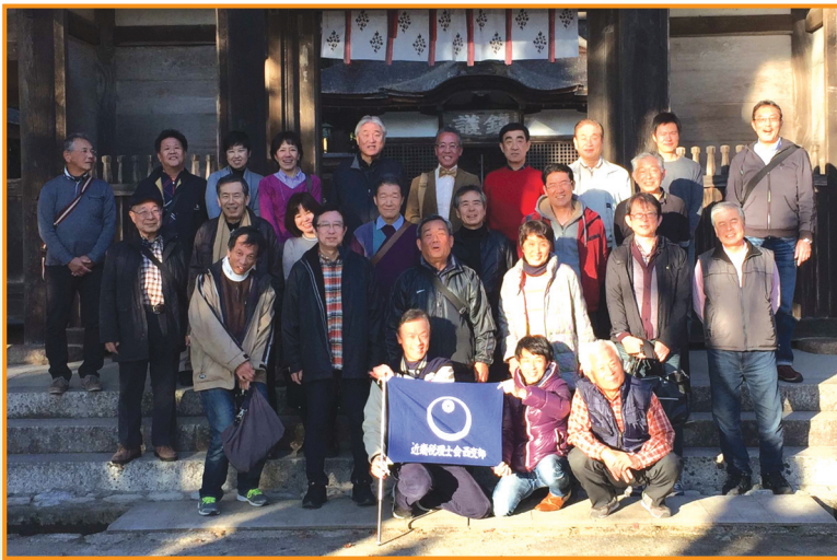
▲日帰り支部旅行（信楽方面）