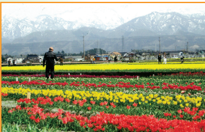
▲北アルプスとチューリップ畑（尾本美恵子 会員）