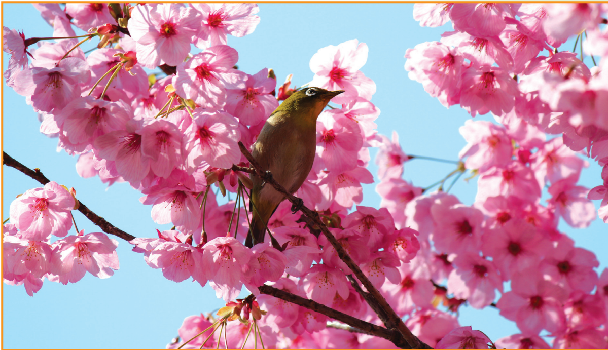
▲春を告げるメジロ（坂口宗春 会員）