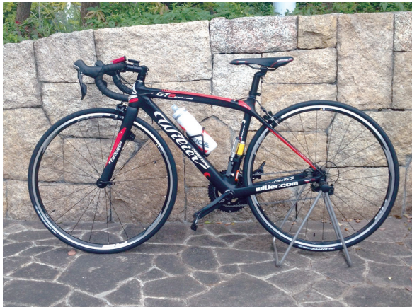
2代目相棒『ウイリ男』

ロードバイクは、足や膝への負担も少ない有酸素運動なので、ムッチリバディを引き締めるためにも、長く楽しく続けていこうと思います。