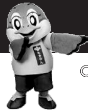
大阪府広報担当 副知事もずやん