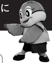
大阪府広報担当 副知事もずやん