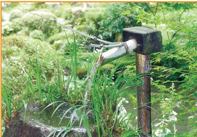
▲大原の里 泉 (千葉照夫 会員)