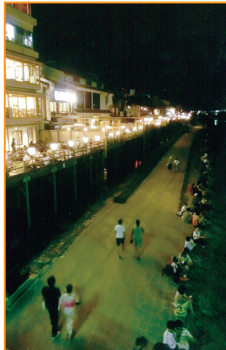
▲夕涼み(鴨川べり) (長畑裕史 会員)