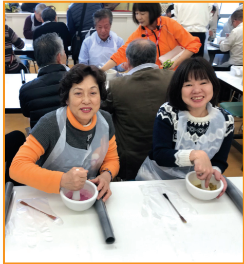
▲日帰り支部旅行 お香づくり