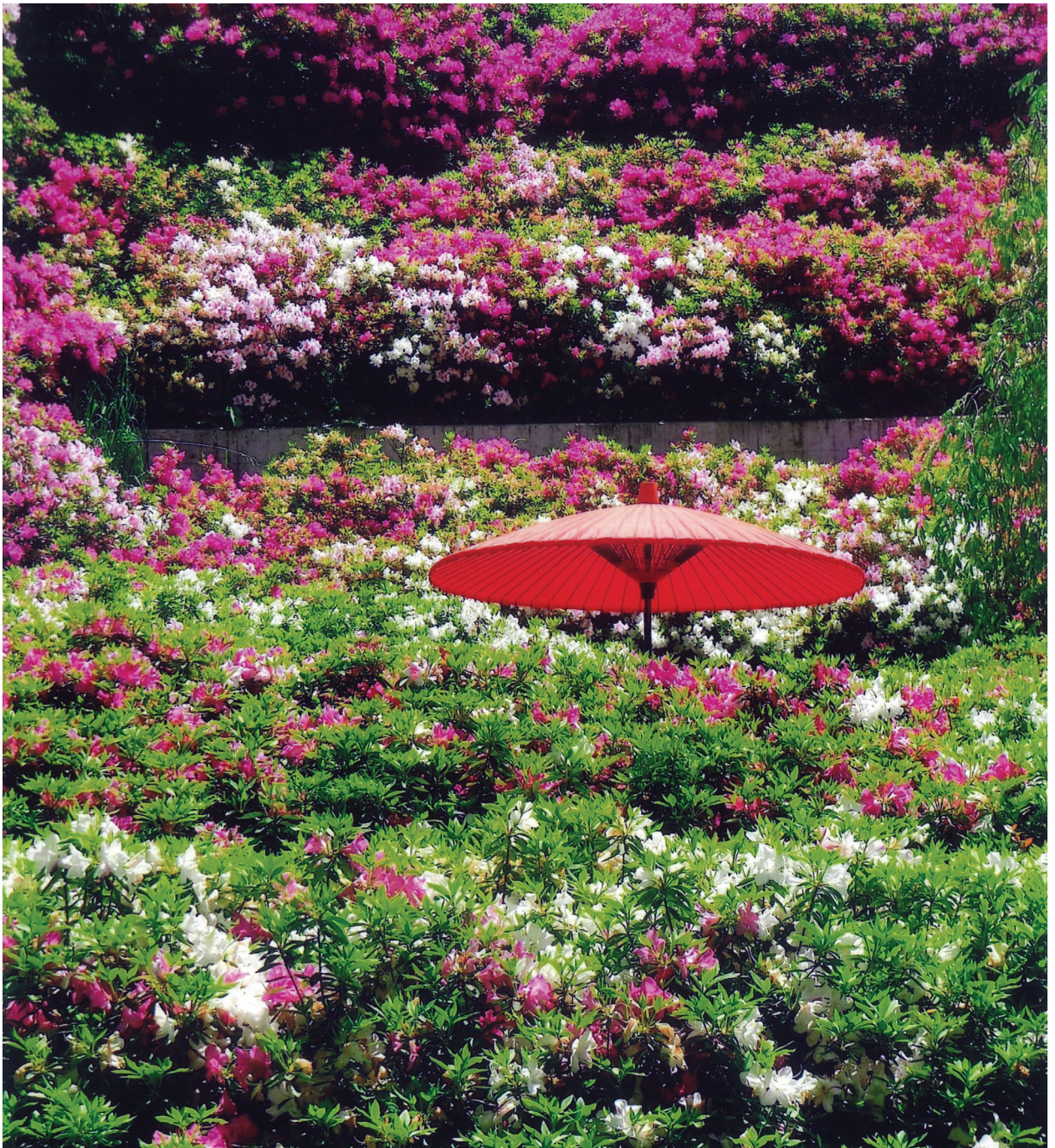
五月晴れ 三室戸寺にて (長畑裕史 会員)

発行所 近畿税理士会西支部 〒550-0021 大阪市西区川口2-7-6 公益社団法人 西納税協会内 発行人 山本 仁昭 編集人 茂見 寛二