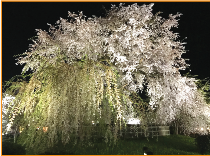
▲円山公園夜桜（茂見寛二 会員）