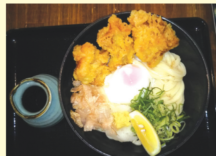
温玉とり天ぶっかけ