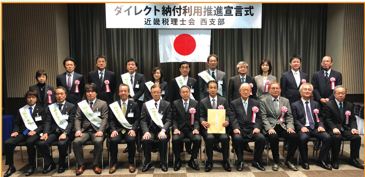
▲ダイレクト納付利用推進宣言式